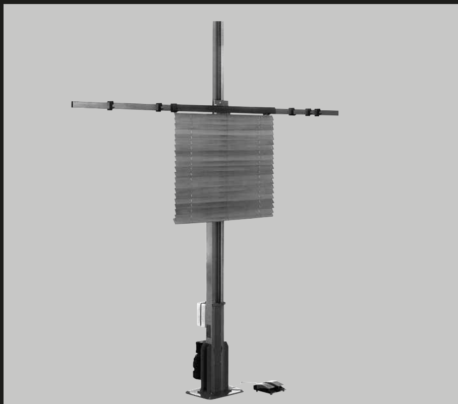
SOLLEVATORE TENDE ALLA VENEZIANA BLIND ASSEMBLY HOIST