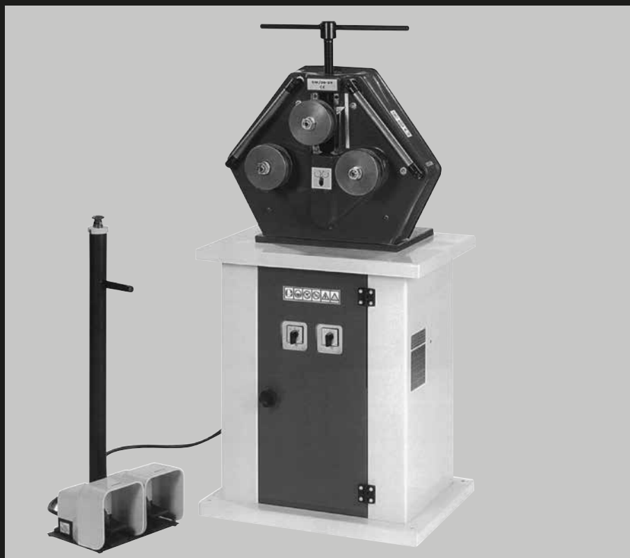
CURVATRICE UNIVERSALE PER PROFILI IN FERRO E ALLUMINIO BENDING MACHINE FOR ALUMINIUM AND IRON PROFILES