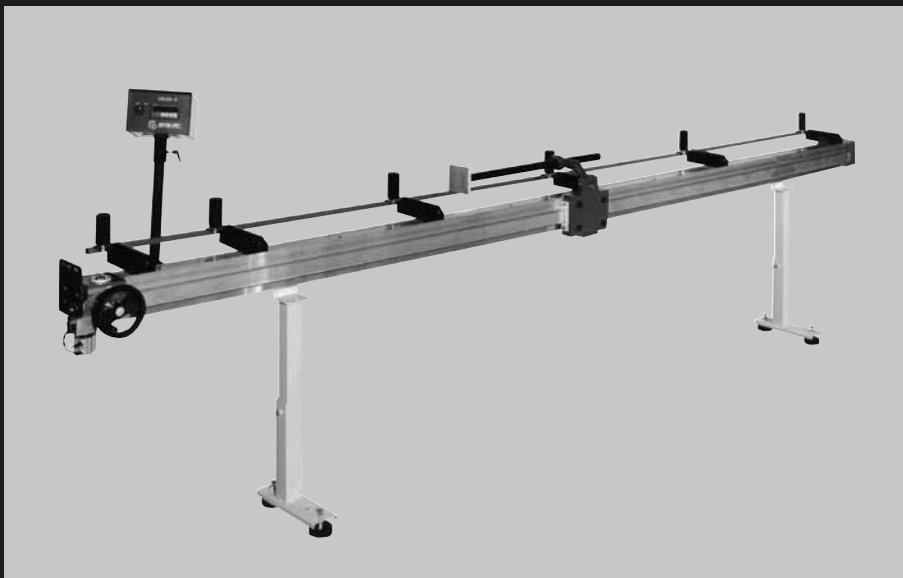
SISTEMA DI RISCONTRO CON RICERCA MANUALE O COMPUTERIZZATA FENCE SYSTEM WITH MANUAL LOCATION OR COMPUTER